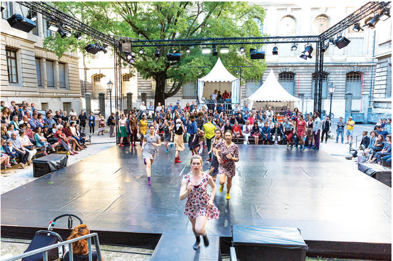
Scène de la danse - juin 2018 - ©Magali Duclos